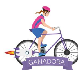
Fase 4 Selección de la ganadora para ir a Singularity University