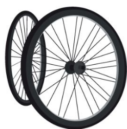
Fase 1 Convocatoria, postulación y selección de 50 emprendedoras