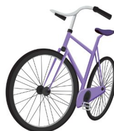
Fase 3 Selección de las 10 finalistas y proceso de mentoring para el desarrollo de proyectos