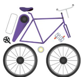
Fase 2 Academia de innovación para mujeres en STEM, que impulsa negocios con sentido